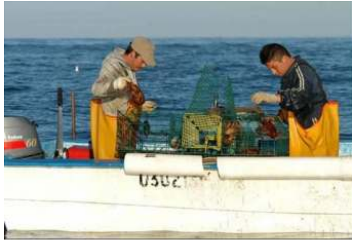
Tabla 4. Cronograma de Actividades Sexenales para el Ordenamiento Ecológico Marino y Regional del Pacífico Norte (OEMyR-PN)